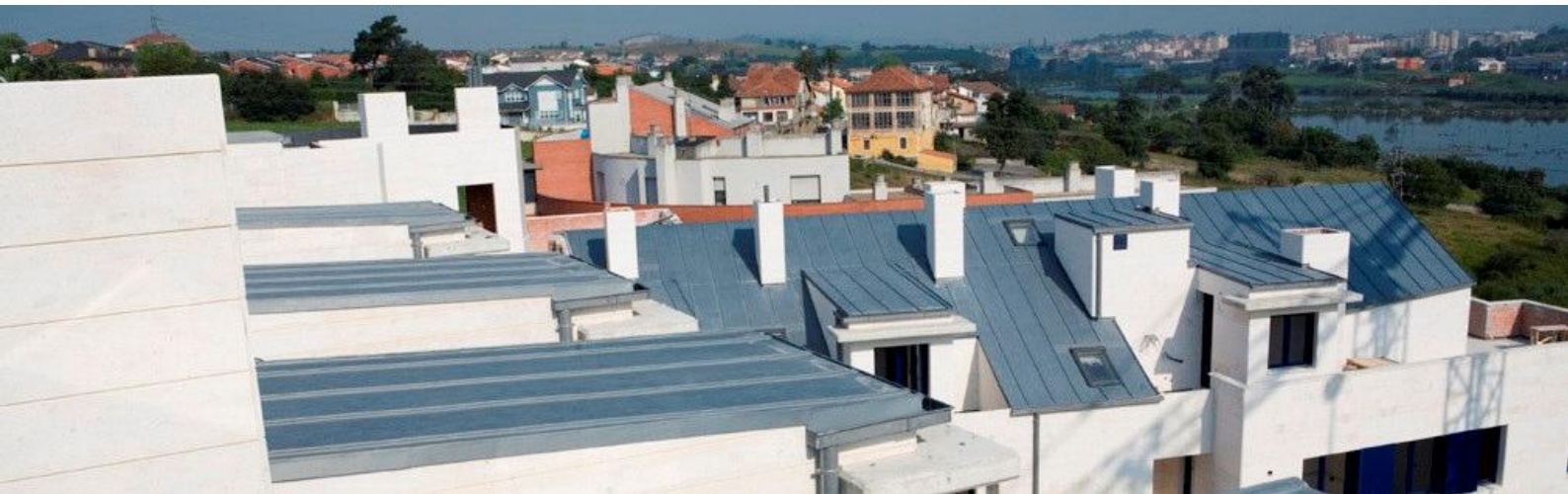
Viviendas en Astilleros, Santander. Cubierta de zinc pigmentado azul

El conocer los colores de estos materiales es importante a la hora de seleccionar otros materiales y acabados / colores (piedra, lacado carpintería etc.) para la misma obra, así que recomendamos se pongan en contacto con nosotros para solicitarnos muestras nuevas, o mejor aún, solicitar una visita de nuestro asesor técnico para que les enseñe muestras nuevas y envejecidas a la intemperie de estos materiales.