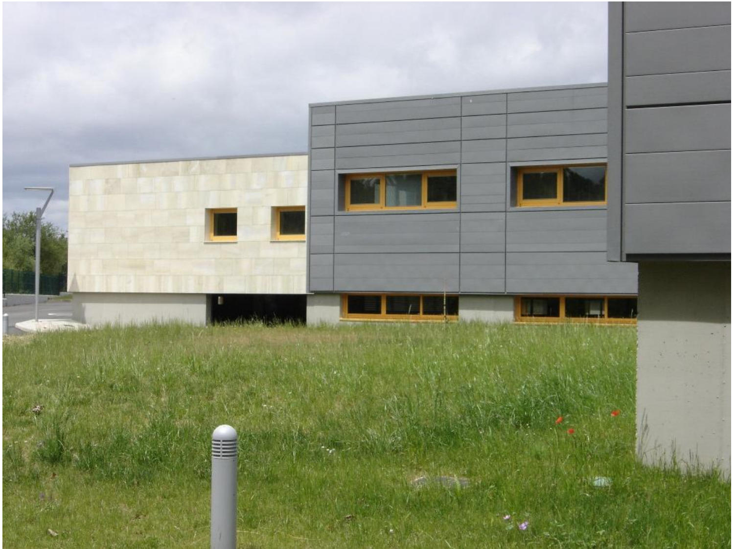
Laboratorio Regional de Sanidad Animal, Villaquilambre, León. Fachada de zinc prepatinado en paneles de fachada